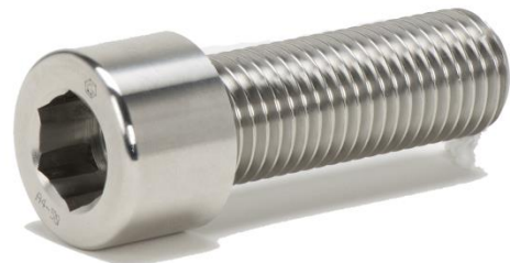
Verbindungselemente nach Norm (aus speziellen Werkstoffen oder mit Spezifikation)