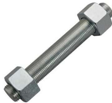
Studbolts / Gewindestücke