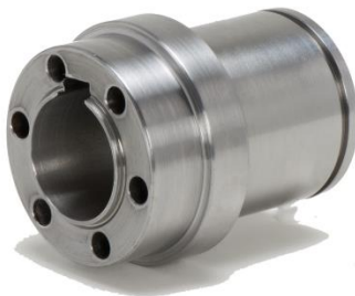
CNC-Dreh- / Frästeile