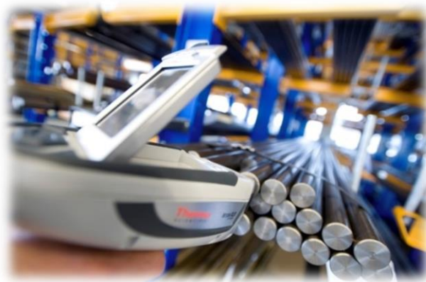
Wareneingangsprüfung mittels Röntgenfluoreszenzanalyse (RFA)